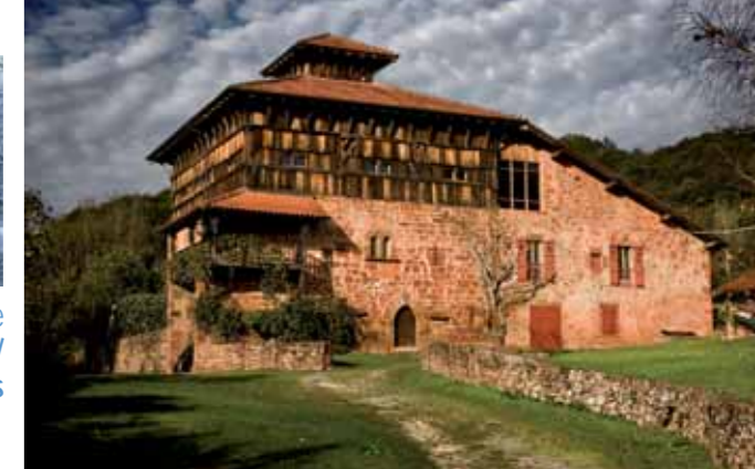
▲ Palacio de Jauregizarrea en Arraioz