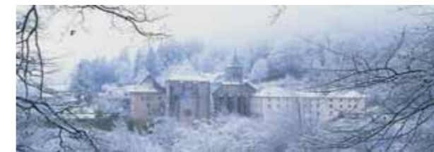
▲ La Colegiata de Orreaga/Roncesvalles